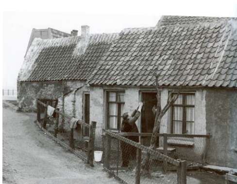
Woningen aan de Huissense Dijk

Wij kwamen midden in de nacht aan in Huissen, geen verlichting, in het pikke donker trokken wij naar een huis aan de dijk bij het café van Willem Siepman.